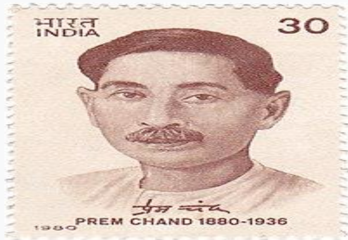
डाक टिकट पर प्रेमचंद