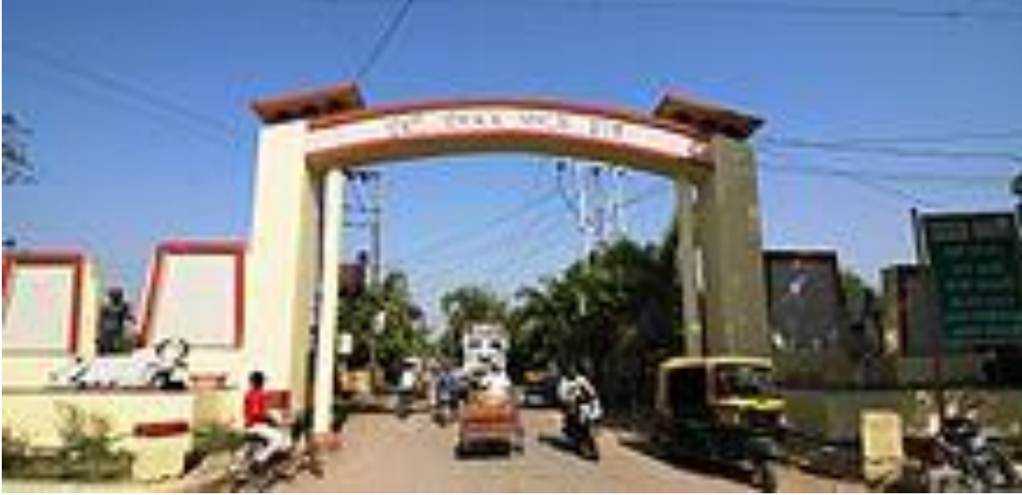
प्रेमचंद स्मृति द्वार, लमही, वाराणसी