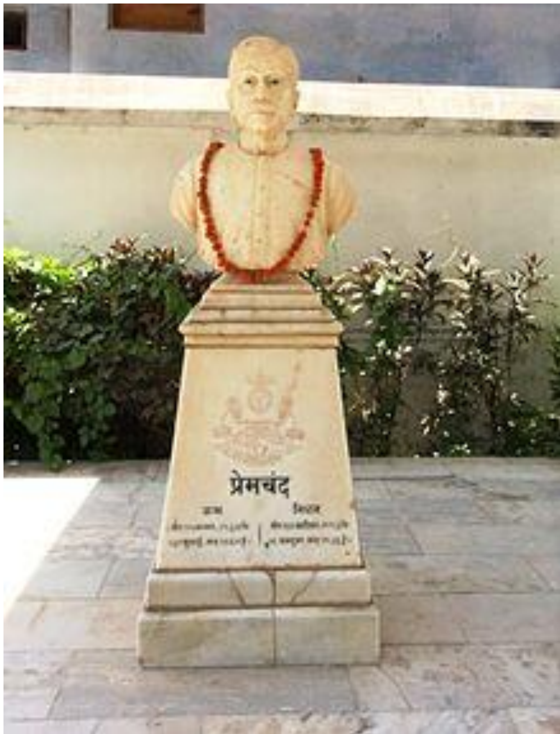
लमही में प्रेमचंद की प्रतिमा

से एक तेलुगू फ़िल्म बनाई, जिसको सर्वश्रेष्ठ तेलुगू फ़िल्म का राष्ट्रीय पुरस्कार भी मिला। १९६३ में गोदान और १९६६ में गबन उपन्यास पर लोकप्रिय फ़िल्में बनीं। १९८० में उनके उपन्यास पर बना टीवी धारावाहिक निर्मला भी बहुत लोकप्रिय हुआ था। स्मृतियाँ